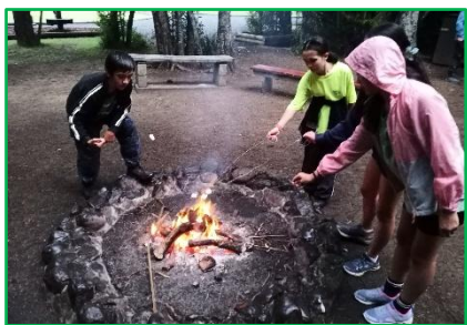
【キャンプファイヤー】