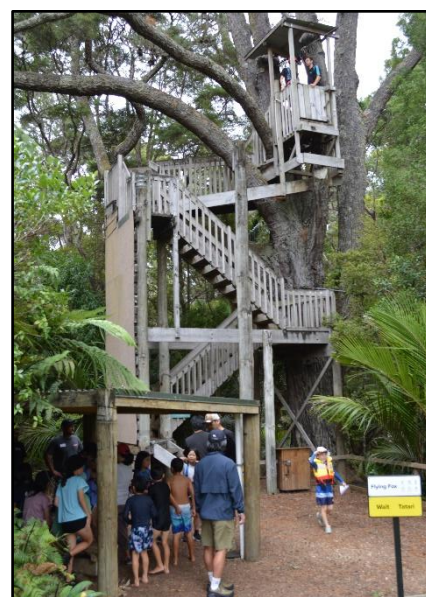
【フライングフォックス】