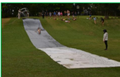
【スリップ&スライド】