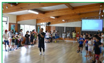
【小・校長先生レクリエーション】

今後もオークランド日本語補習学校は、子どもたちの成長を支える様々な活動を続けて参ります。引き続きご支援とご協力を賜りますようお願い申し上げます。(青柳)