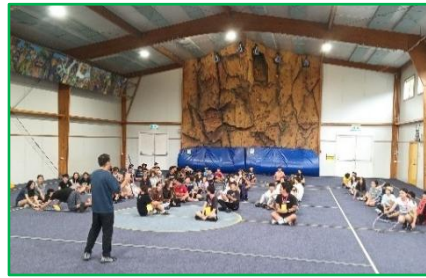
【2日目・校長先生レクリエーション】