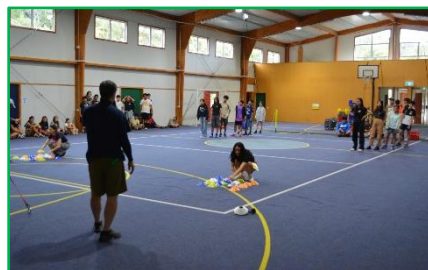
【中・縦割り班活動】