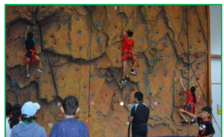
【ロッククライミング】